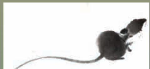
La souris | Peter Cheng | Encre