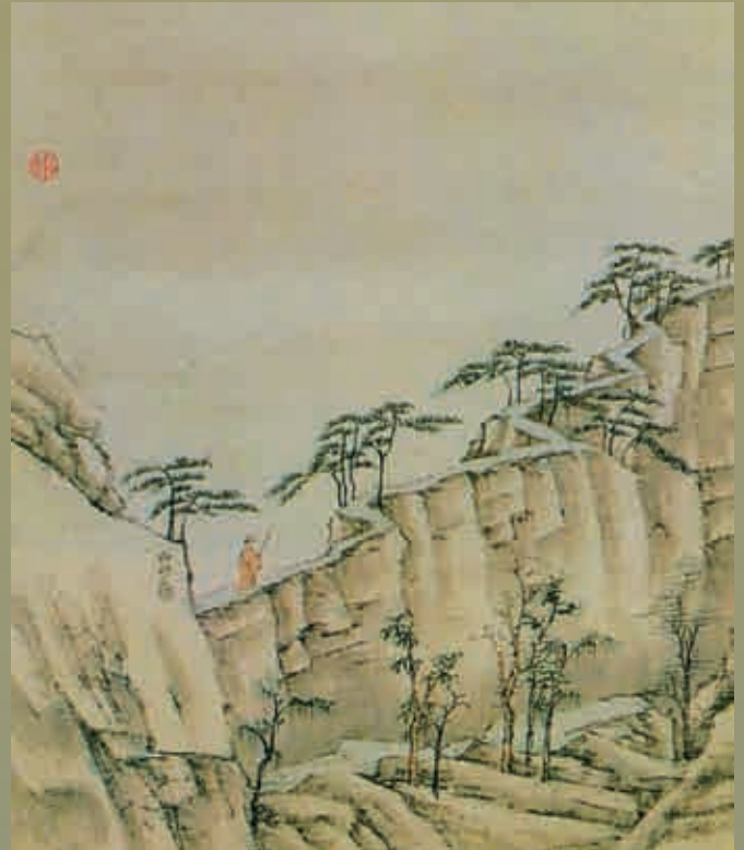
Les Monts Huang | Hongren (1610-1663) | Encre et couleur | Musée impérial de Pékin,

Règle 2 : Pour peindre à la chinoise, peindre d'abord 3 mois de bambous, ça donne de l'endurance, et assouplit le poignet. Le coup de bambou, la tendinite du peintre débutant ?